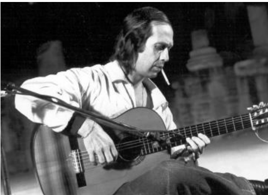
Paco de Lucía,

obwohl offensichtlich nicht gerade bequem, haben viele Leute seine unorthodoxe Haltung nachgeahmt.